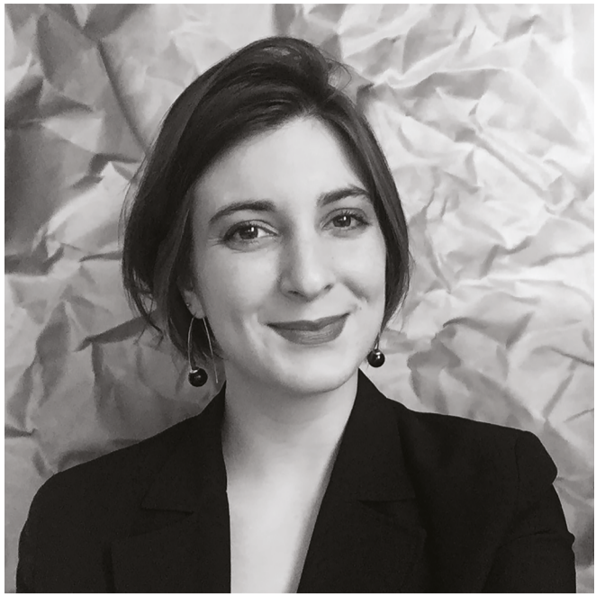
23 ans - permis B - véhiculée et mobile

2013 - BAC ES option arts plastiques Pont-Audemer